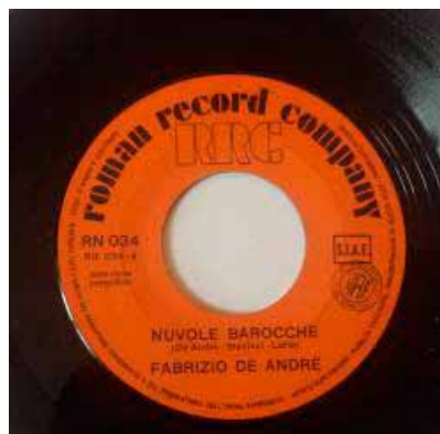
Il 45 giri di 'Nuvole barocche'