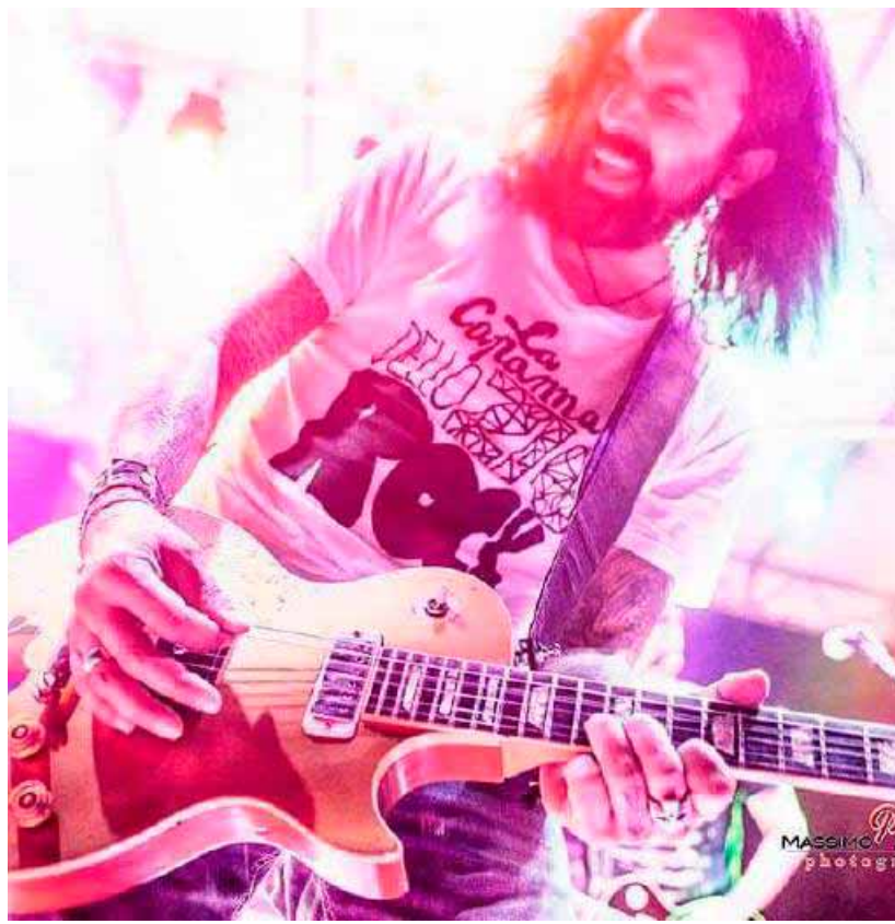
Omar Pedrini domani sera sarà in versione acustica al Sound di Soresina