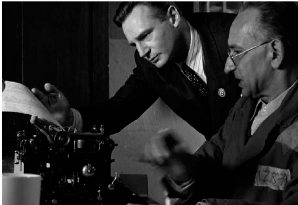
Una scena tratta da Schindler's list , il film del 1993 diretto da Steven Spielberg