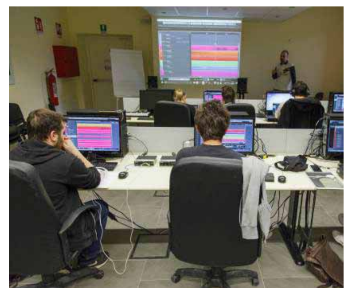
Una lezione sul software per comporre musica

denti del liceo musicale Stradivari, ma il dipartimento è aperto a nuove convenzioni). Il monte orario complessivo sarà di 21 ore per entrambi. Al termine dei corsi e a seguito del positivo superamento dell'esame conclusivo verranno rilasciati ai partecipanti attestati di certificazione ufficiali direttamente da Steinberg, l'azienda produttrice dei software utilizzati. Per maggiori informazioni: pierluigi.bontempi@unipv.it , http://digital-lab-cremona.unipv.it .