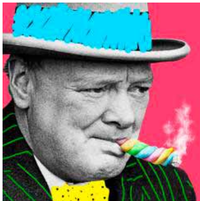
La copertina dell'album

■ CREMONA Xin Xin è il titolo del primo singolo e videoclip dei Candies For Breakfast , dal 7 marzo online (distribuzione digitale Artist First/IndieBox Music), prima anticipazione dell'album d'esordio della formazione alternative rock cremonese in uscita il 23 marzo. Con questa canzone i Candies For Breakfast fanno il loro debutto e scelgono un pezzo dal ritmo serrato, dal riff ipnotico, con un testo che si ribella alla malinconia e alle piccole e grandi noie quotidiane. Il videoclip mette in scena le difficoltà di un viaggio in quattro sui sedili posteriori di un'automobile: fastidio, insoddisfazione, momenti divertenti e montaggio frenetico. Piccole scoccature che non fanno mai perdere il sorriso. Il video è girato da Luca Catullo ( Bazoo Bzk Prod ) nelle campagne